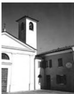
La Chiesa parrocchiale di Villanova Maiardina