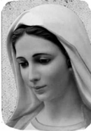
Små och stora mirakel

Många gånger tar något slut, man vet inte hur eller varför, men det tar slut. Vi tror att det alltid är de andras fel, eller att det beror på oförutsedda händelser. ”Om bara inte detta hade hänt... om den där personen inte hade lagt sig i... skulle det ha gått som på räls, tänker vi. men tyvärr är det inte så.